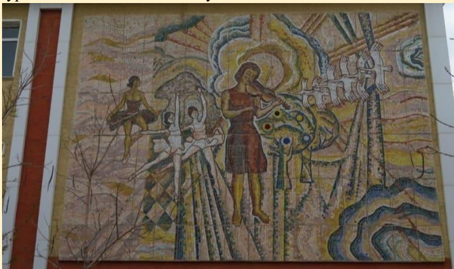
Мозаичное панно «Искусство»