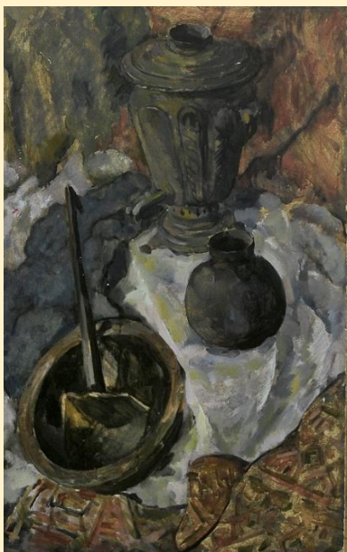
Натюрморт «Старые вещи»