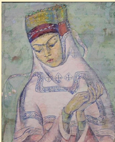
Живописная картина «Невеста»

Полотно «Микрорайон строится» изображает бытовую сцену семейства, готовящегося к переезду в новый дом, их ожидание от новоселья и радостных дней. Правдивость и жизненность передают образы членов семьи и окружающую среду благодаря гармоничному цветовому сочетанию.