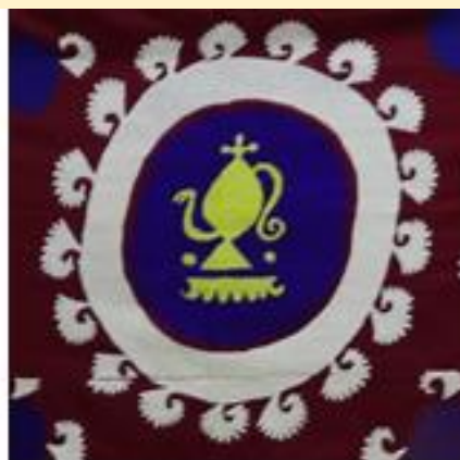
Samarqand kashtasi, fragment. №5386-15. "choynik " nusxa naqshi