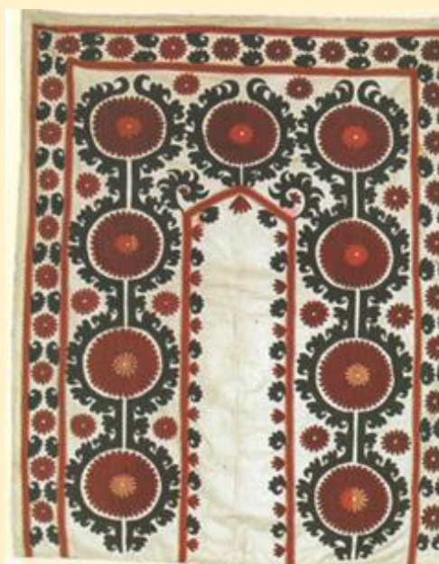
Samarqand kashtasi joynamozda “otash-aroba”- poyezd naqshi, XX asr boshi.