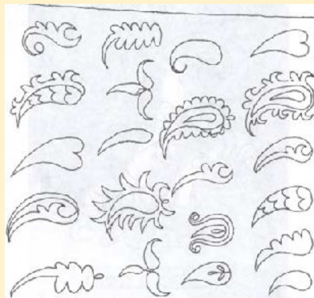
Samarqand kashtasida qalampir ramziy naqshi. O'. Umurboyeva 1935 yil