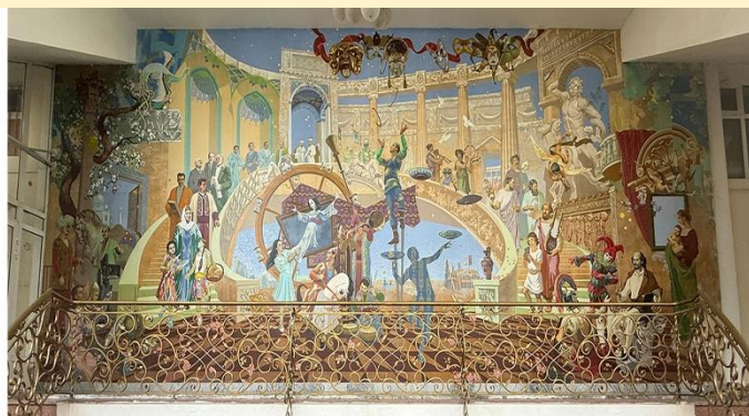
«Вечная сцена». О.Исламов

Фреска построена из трёх взаимосвязанных частей. Слева Исламов показывает эволюцию узбекского искусства, театра и кино — дань национальным достижениям и культурной преемственности. Справа сюжет уходит в доисторические и классические времена. Здесь возникает мир Древней Греции и Рима, где открытые театры формировали основы западной драмы. Фигуры Сократа, Аристотеля и Гомера спускаются по лестнице, олицетворяя вечное стремление к знанию.