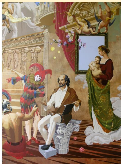
Сикстинская Мадонна. Рафаэль. Фрагмент. Вечная сцена. О.Исламов.

Академическая основа и исключительный опыт