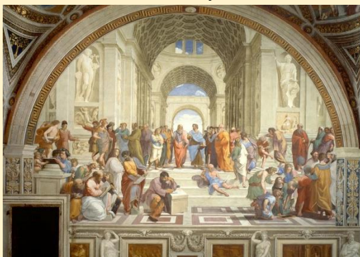
«Афинская школа». Рафаэль.

Монументальная композиция Вечная Сцена охватывает зрителя своим круговым ритмом, напоминая объятие театра. Стоя перед шестиметровым на двенадцатиметровым полотном, зритель перестаёт быть пассивным наблюдателем и становится частью грандиозного спектакля, где на одной плоскости разыгрываются эпохи философии, искусства и человеческой судьбы.