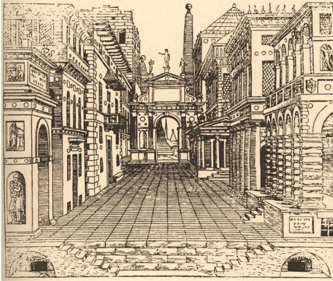
S.Serlio. Tragediya dekoratsiyasi. 1545.

edi. (Biroq, ko'pincha ular, tirik ijrochilar, rassomning ko'rsatmalariga binoan sahnada harakat qilishgan – bunga misol tariqasida, Leonardo da Vinchi 1487 va 1491 yillarda Milandagi saroylarida o'tkazilgan tantanalarda paytida berilgan spektakllarni faqat bezatish bilangina shug'illanib qolmasdan, balki "rejissyorlik" qilgan.) [3,b.34]